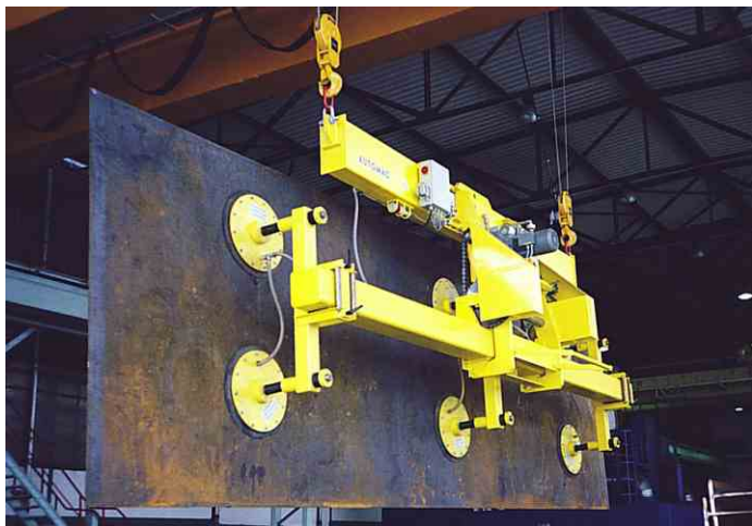
Vakuumhebetraverse (Tragfähigkeit 4t horizontal, 2t vertikal)

AUTOMAC - Vakuumhebeegeräte zeichnen sich durch einen breiten Unterdruckarbeitsbereich aus und haben höchstes Sicherheitsniveau.